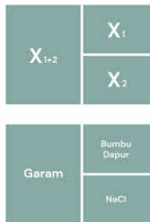
Gambar 1. Rumusan Perbandingan Sebuah Kata dalam Medan Semantis

senyawa kimia yang bisa dicampurkan dengan senyawa kimia lainnya. Jadi, meskipun ekspresi mereka keduanya sama, tetapi isinya tetap mempunyai perbedaan. Ini bisa kita lihat di dalam tabel berikut 9 :