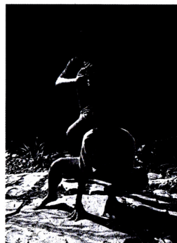
Bayu dan Laksmi berlatih bersama.

Yang membuat Para Perasuk lebih dari sekadar film drama supernatural