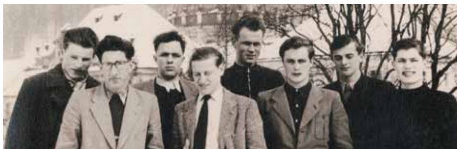
Franz menjalani masa Gymnasium di Kolese Santo Blasius

Dalam IDT, Romo Magnis menjelaskan lima tantangan umat manusia yang amat serius: (1) krisis demokrasi, di mana populisme dan kebencian antar golongan semakin meruncing, (2) ekstremisme ideologis-agamis, (3) kapitalisme dan ancaman kelaparan, (4) keambrokan